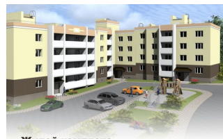
Жилой комплекс «Веризинский»