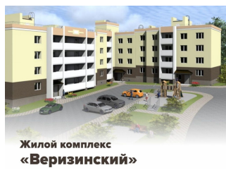
Жилой комплекс «Веризинский»