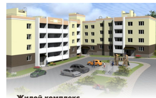
Жилой комплекс «Веризинский»